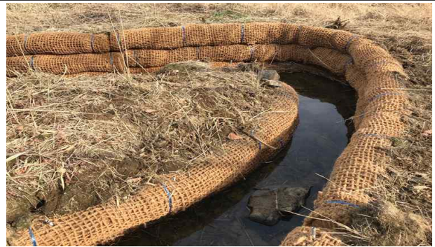
(새굴방지 사업 후)